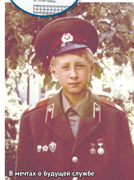
В мечтах о будущей службе

Ему было лет пять, когда однажды с самым серьезным видом сказал маме: «Собери харчей, в армию ухожу». Сложил в видавший виды