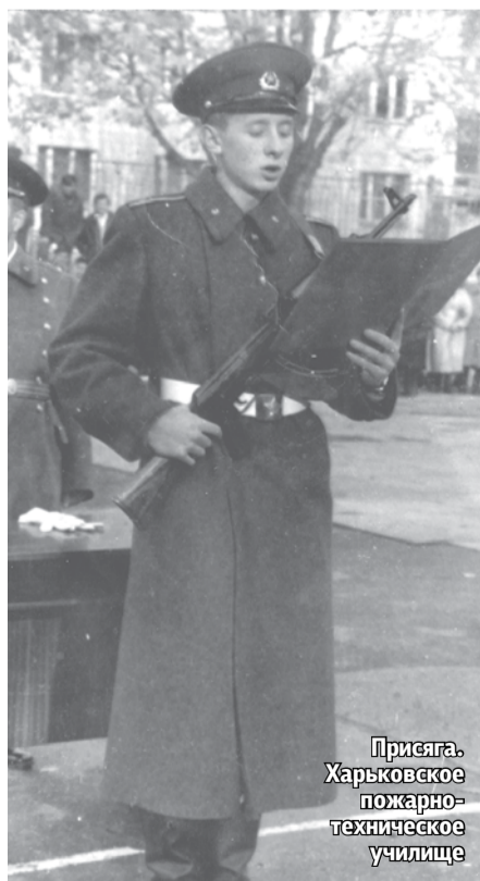
Присяга. Харьковское пожарно- техническое училище

Молодой лейтенант сразу удивил сослуживцев своей необыкновенной способностью быть «на ты» с любой техникой. Он не считал зазорным помочь водителю отремонтировать автомобиль, виртуозно управлялся с любыми инструментами, мог дать дельный совет по ремонту самых разных механизмов. И не просто