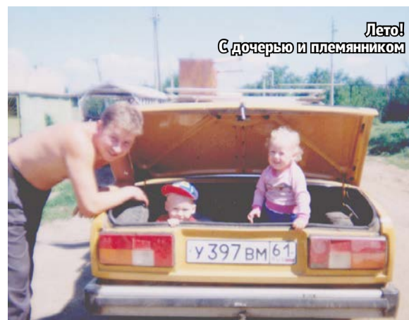
Лето! С дочерью и племянником

что я очень сильно удивилась, узнав, какой это вуз – Академия государственной противопожарной службы МЧС России. Наверное, выбор дочери такого отца вполне объясним.