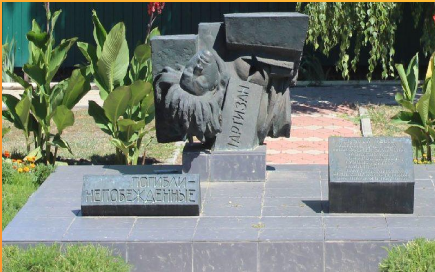
ст-ца. Романовская Волгодонского района. Памятник героям Романовского подполья