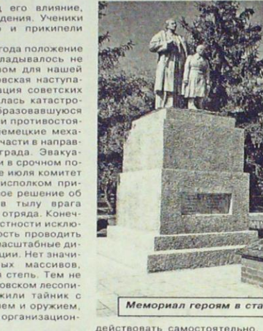
Мемориал героям в станице Романовской

попадали под его влияние, силу его убеждения. Ученики полюбили его и прикипели всей душой. Летом 1942 года положение на фронте складывалось не лучшим образом для нашей армии. Харьковская наступательная операция советских войск закончилась катастрофой, и в образовавшуюся брешь на линии противостояния хлынули немецкие механизированные части в направлении Сталинграда. Эвакуацию проводили в срочном порядке, в начале июля комитет ВКП (б) и райисполком приняли совместное решение об организации в тылу врага партизанского отряда. Конечно, условия местности исключали возможность проводить здесь широкомасштабные диверсионные акции. Нет значительных лесных массивов кругом – голая степь. Тем не менее, в Потаповском лесопитомнике заложили тайник с продовольствием и оружием, провели меры организационного порядка.