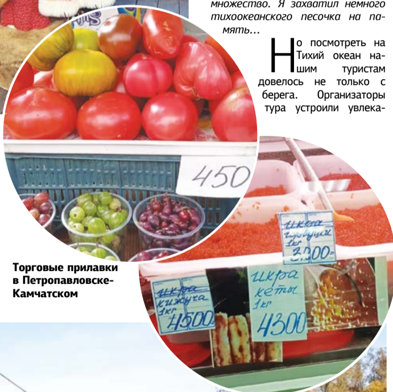
Торговые прилавки в Петропавловске-Камчатском

Н о посмотреть на Тихий океан нашим туристам довелось не только с берега. Организаторы тура устроили увлекатель-