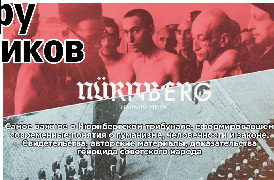
Самое важное о Нюрнбергском трибунале, сформировавшем современные понятия о гуманизме, человечности и законе. Свидетельства, авторские материалы, доказательства геноцида советского народа

С противомикробным препаратом сульфаниламидом экспериментировали в концлагере Равенсбрюк с июля 1942 года до авгу-