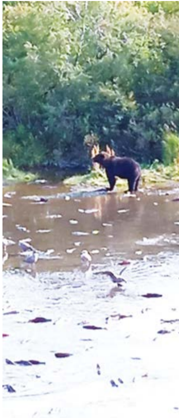
Мишки тоже любят рыбу

Сплавились на рафтах по реке Быстрой, куда заходит на нерест