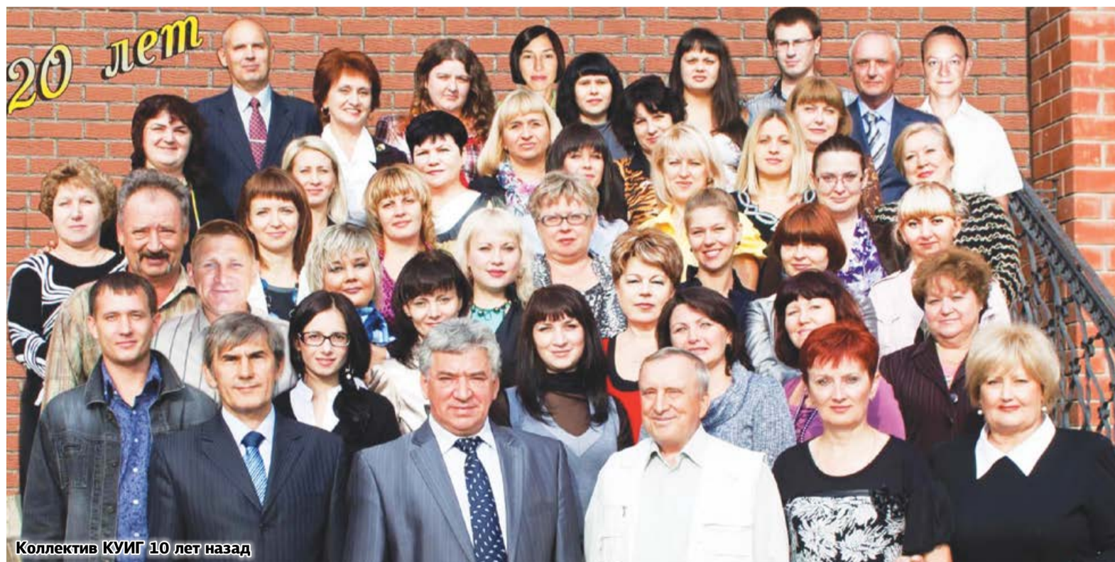
Коллектив КУИГ 10 лет назад