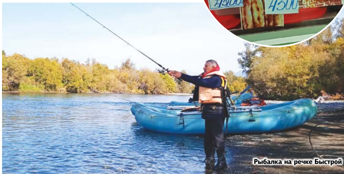
Рыбалка на реке Быстрой