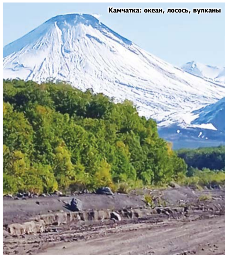
Камчатка: океан, лосось, вулканы