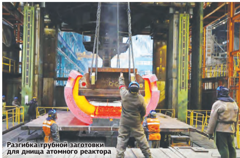
Разгибка трубной заготовки для днища атомного реактора

Ф илиал АО «АЭМ-технологии» Атоммаш – один из основных поставщиков оборудования для предприятий атомной промышленности, нефтегазового комплекса, тепловой энергетики. Забота о сотрудниках, возможный карьерный рост, перспективы развития – здесь все делается для того, чтобы люди имели возможность полноценно работать, получая за свой труд достойную зарплату.