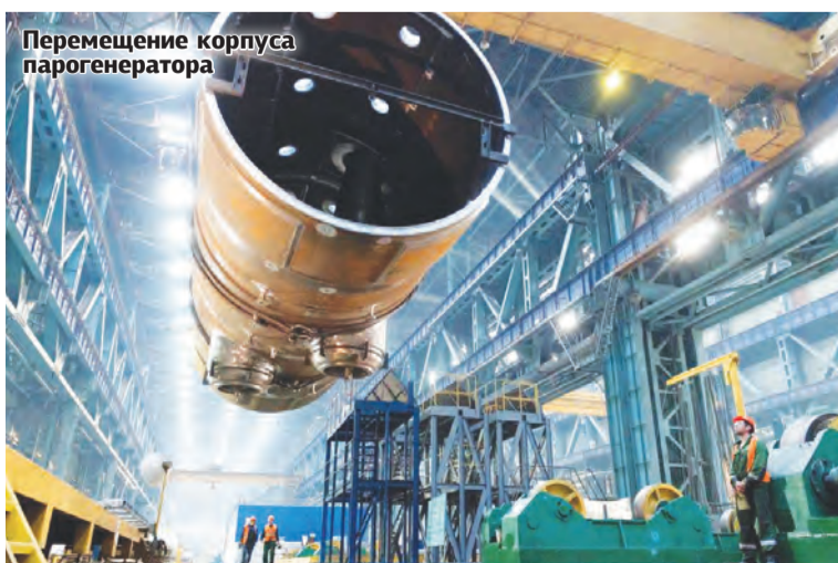
Перемещение корпуса парогенератора